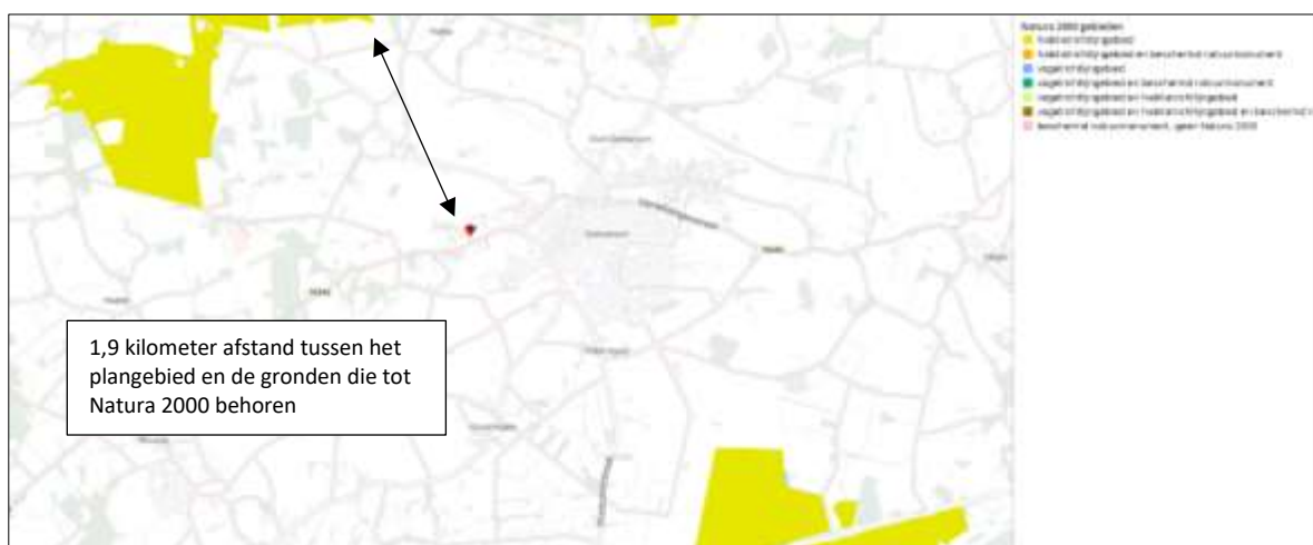
Ligging van Natura 2000-gebied in de omgeving van het plangebied. De ligging van het plangebied wordt met de rode marker aangeduid. Gronden die tot Natura 2000 behoren worden met de okergele kleur aangeduid.

Het plangebied ligt op minimaal 1,9 kilometer afstand van Natura 2000-gebied. Het meest nabij gelegen Natura 2000-gebied, is Springendal & Dal van de Mosbeek. Er liggen nog andere Natura 2000-gebieden in de omgeving van het plangebied, maar die liggen op grotere afstand. Op onderstaande afbeelding wordt de ligging van Natura 2000-gebied in de omgeving van het plangebied weergegeven.