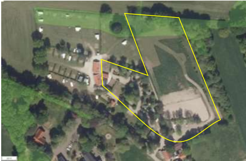
Ligging van het Natuurnetwerk Nederland in de omgeving van het plangebied. Het plangebied wordt met het gele kader aangeduid.