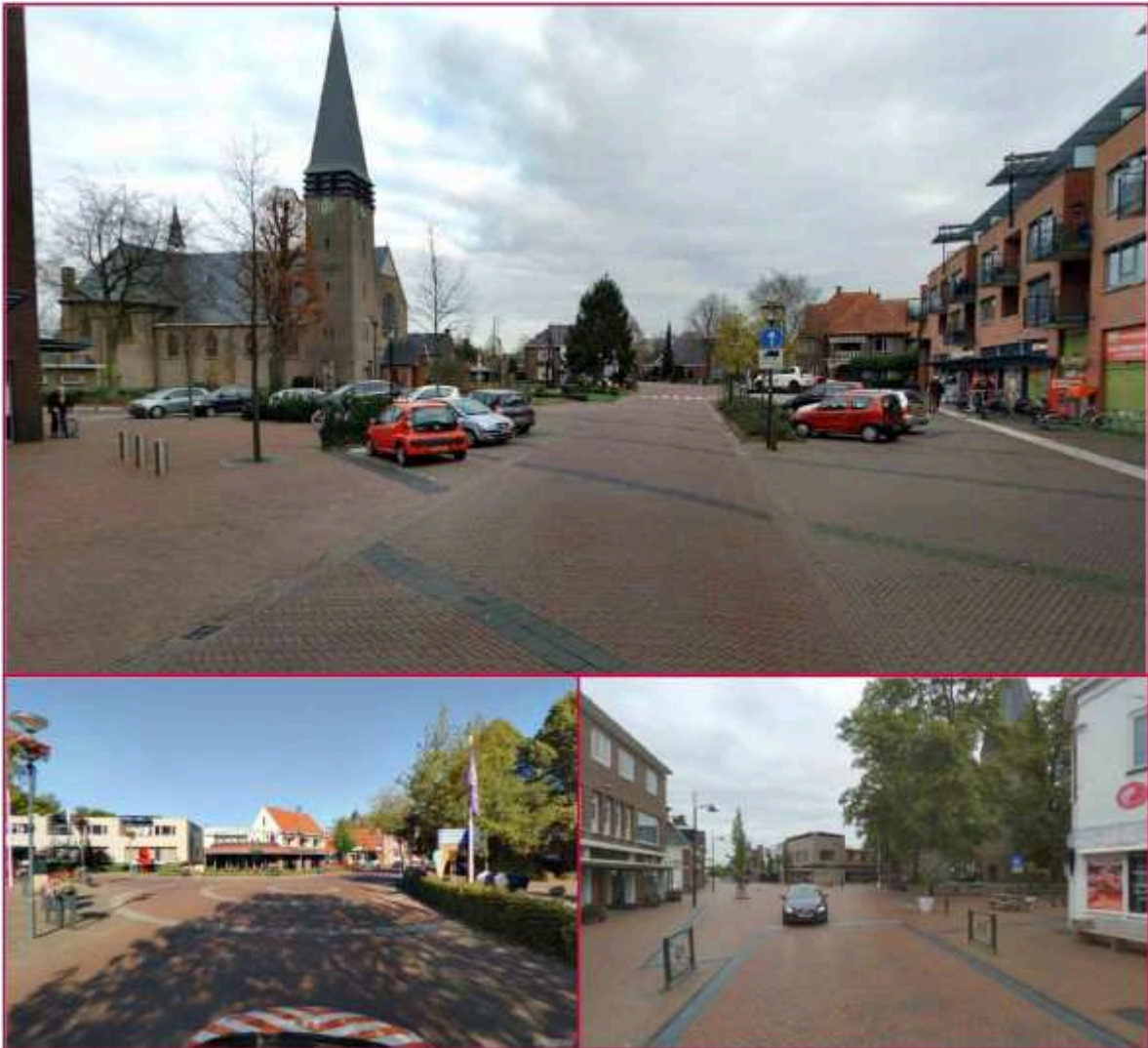
Referentiebeelden weginrichting volgens shared-space principe