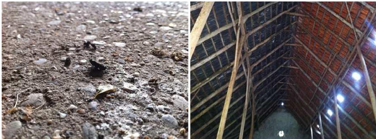
Uitwerpselen van een vleermuis. Gevonden in de stal achter de boerderij.

Tijdens het bezoek zijn geen vleermuizen waargenomen. In de stal, achter de boerderij, zijn enkele uitwerpselen gevonden van vleermuizen, vermoedelijk van een laatvlieger. Het gaat daarbij slechts om een geringe hoeveelheid waardoor geconcludeerd mag worden dat deze stal niet gebruikt wordt als vaste verblijfplaats.