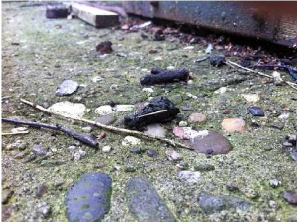
Uitwerpselen van de steenmarter.

Er zijn in het onderzoeksgebied geen beschermde soorten waargenomen, maar het is aannemelijk dat het onderzoeksgebied tot het functionele leefgebied van sommige algemene- en weinig kritische zoogdiersoorten als konijn, haas, egel, bunzing en steenmarter behoren. Er zijn geen vaste verblijfplaatsen van deze soorten in het gebied aangetroffen. De soorten benutten het onderzoeksgebied als foerageergebied. Nabij de ligboxenstal zijn uitwerpselen gevonden van de steenmarter.