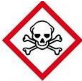
GHS06 Giftige stoffen (TO)