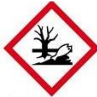
GHS09 Schadelijk voor het milieu (EN)