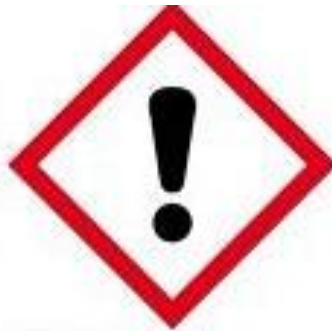
GHS07 Gevaar voor irritatie, bij inademen (DA)