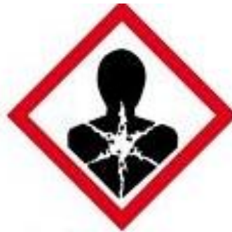
GHS08 Kankerverwekkend, mutageen (MU)