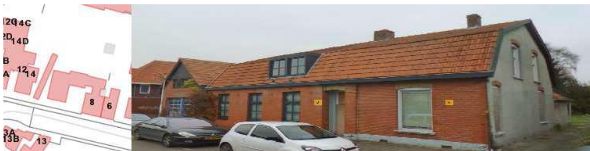
Figuur: bestaande situatie Ootmarsumsestraat 6-8

In Denekamp, aan de Ootmarsumsestraat 6-8, bevindt zich een samengesteld gebouw dat binnen bestemmingsplan "Denekamp" een woonbestemming heeft. Op de figuur hieronder is de locatie weergegeven met een foto vanaf de straat.